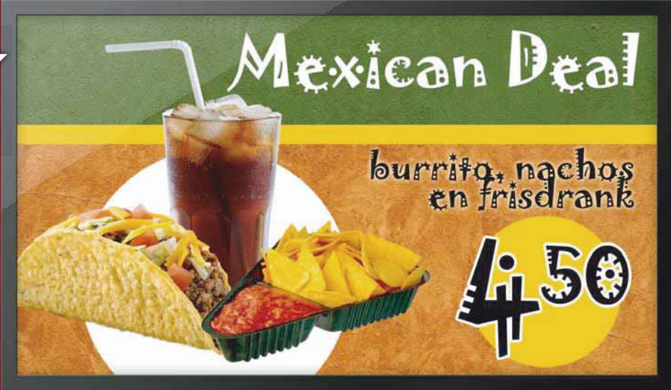
Meer omzet per klant met combinatie-aanbiedingen.