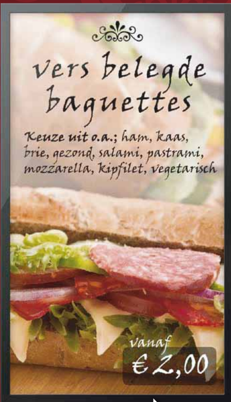
Uw verleidelijke aanbieding smakelijk in beeld.

Upgrade uw prijslijst met aantrekkelijke aanbiedingen.